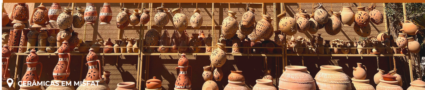
📍 CERÂMICAS EM MISFAT

Abraços, emoções e risos, e a promessa que nos veremos na próxima expedição com a VIVA